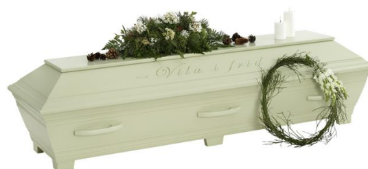
Kista furu, Lindblomsgrön (Kullamark) med avskedshälsning ingraverad

Kistdekoration som är på bilden ingår ej.