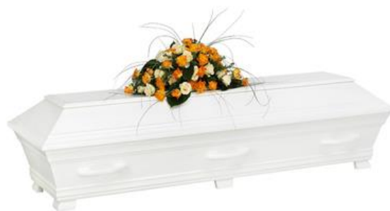
Kista furu, solidvit (Alvö)

Kistdekoration som är på bilden ingår ej.