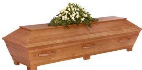
Kista i furu, målad antik brun. (Sandholm)