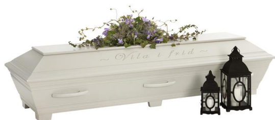
Kista i furu, mätad, (Kullamark) Allmoge grå med avskedshälsning ingraverad