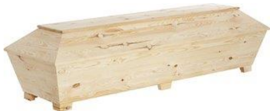
Kista i ren obehandlad furu. (Ängsro)