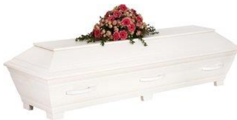
Kista furu, målad vit. (Sandholm)

Kistdekoration som är på bilden ingår ej.